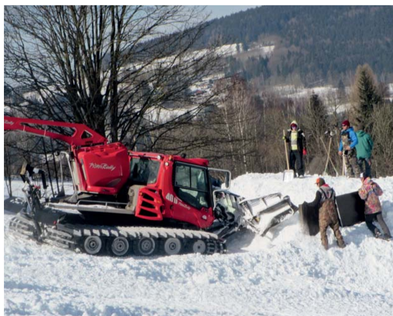
Deštné v Orlických horách neláká jen příznivce uměřeného sjezdového lyžování (potažmo snowboardingu) či běžeckého lyžování. Na své si zde přijdou i milovníci adrenalinových sněžných parků s umělými skoky a dalšími překážkami. Jenomže takové atrakce ze sněhu modelovat nesnadný je úkol. Při jejich výrobě musí spojit síly lidé i stroje – rolby.