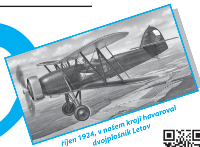
říjen 1924, v našem kraji havaroval dvojplášník Letov