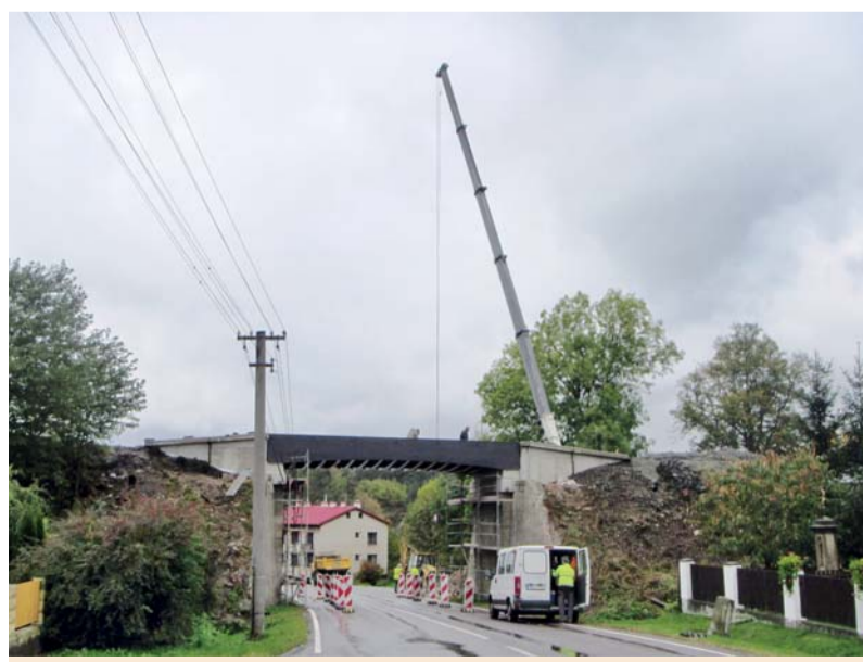
Výměna mostní konstrukce na železničním mostě v obci Vysokov u Náchoda.