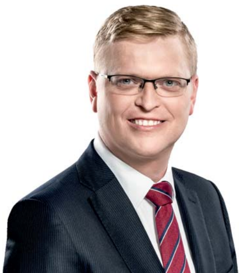
Pavel Bělobrádek místopředseda vlády ČR poslanec PČR

Bez maminek by nebyla nová generace. Bez nové generace by naše země byla prázdná, ztratila by se naše tradice, národní identita, naše kultura, na naše místo by přišli jiní. Matky jsou strážkyněmi krbu a ochránitelkami hodnot. Maminky si zkrátka zaslouží ocenění. V KDU-ČSL to víme a budeme vždy pracovat pro české maminky.