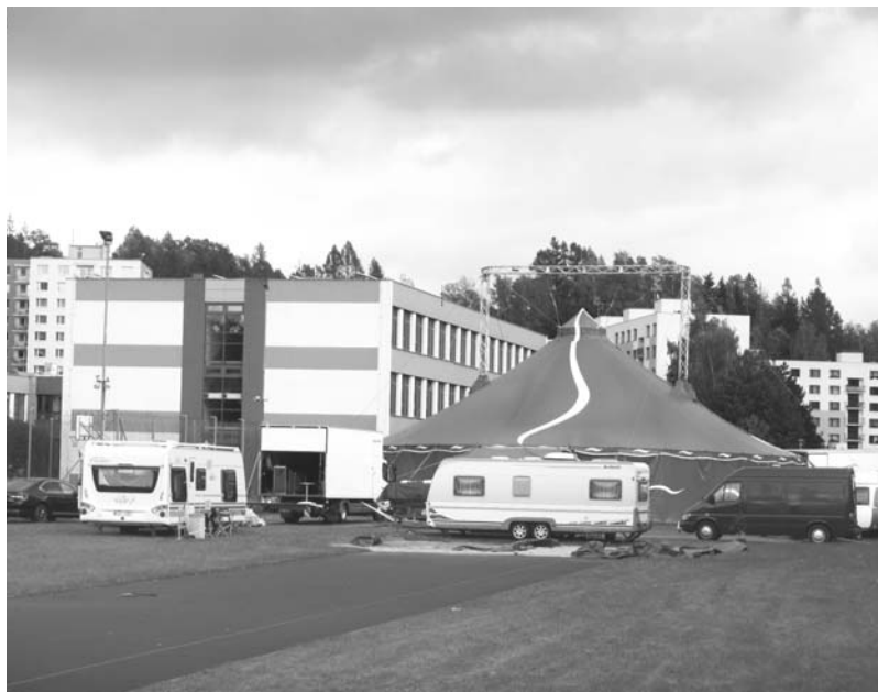
Cirkusový stan v bezprostřední blízkosti ZŠ Náchod – Plhov jako hmatatelný důkaz zajímavého projektu Cirkus Happy Kids, ve kterém si roli cirkusových umělců mohli zkusit samotní žáci této školy.

V Muzeu stavebnice Merkur v Polici nad Metují se nachází exponát, který je zapsán v Guinnessově knize rekordů. Jedná se o obří model inspirovaný románem Ocelové město francouzského romanopisce Julese Verna. Práce na „Ocelovém městě“ z dílů stavebnice Merkur probíhala v letech 2000 – 2016.