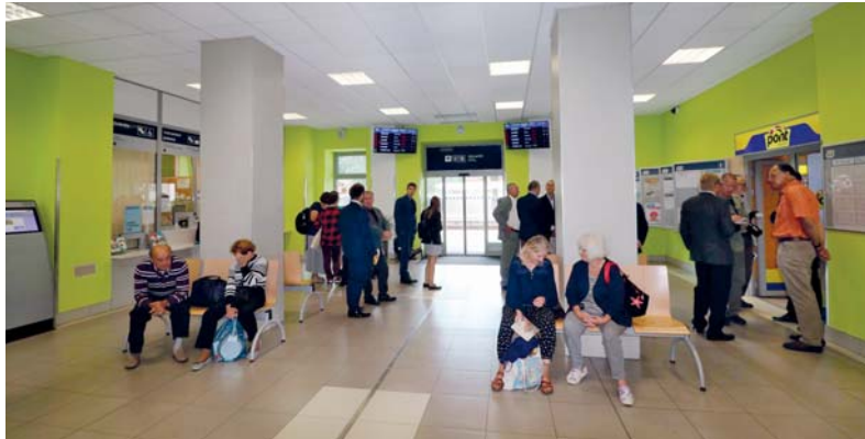
Vlakové nádraží a autobusový terminál v Náchodě se ukončením rekonstrukce spojují v jeden celek, který poskytne cestujícím komfortní a moderní zázemí.

Když jsme v Náchodě v roce 2014 slavnostně uváděli do provozu nákladem 35 milionů rekonstruované autobusové nádraží, slíbil jsem občanům, že je to pouze polovina cesty k modernímu dopravnímu uzlu v Náchodě. A o letošních prázdninách jsme konečně po třech letech