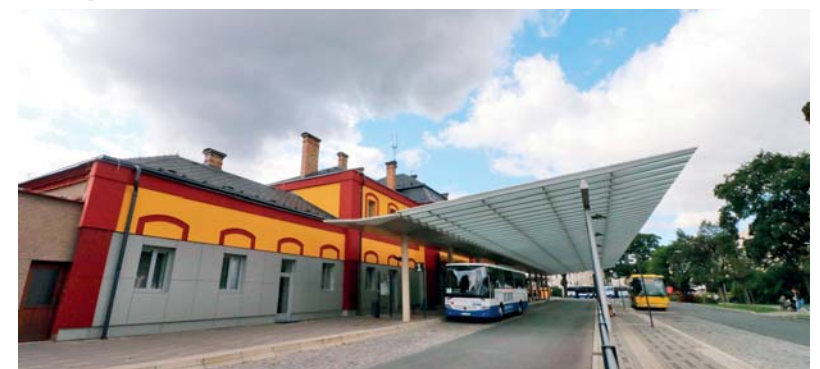
Historická budova vlakového nádraží dostala „nový kabát“. Hlavní změnu však lidé pocítí v interiéru budovy, který se kompletně proměnil a respektuje potřeby cestujících veřejnosti ve 21. století včetně požadavků na sociální zázemí, možnost občerstvení či přehledné zajištění dopravních informací.

dosáhli úplného cíle. Můžu si tak s ulehčením říci: Splněno! Důkazem je opravená budova vlakového nádraží. Během postupné rekonstrukce zde České dráhy a Správa železniční dopravní investovaly 34,5 milionu korun. Pokud správně počítám, máme na podzim roku 2017 k dispozici moderní vlakové a autobusové nádraží za téměř 70 milionů korun! V budově vlakového nádraží je nyní komfortní zázemí