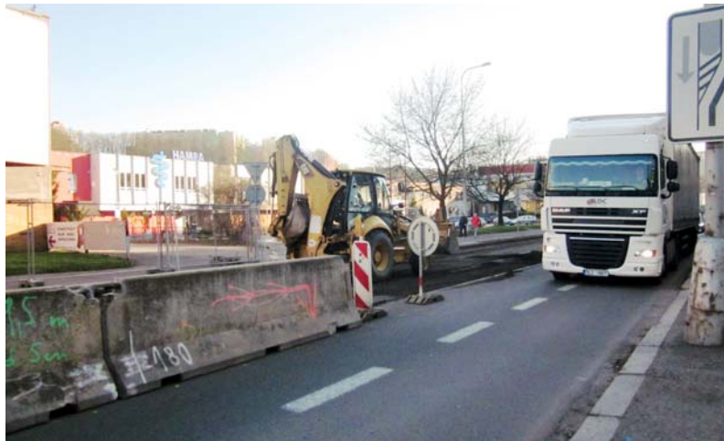
Na opravy kruhových křižovatek a rekonstrukci průtahu Náchodem uvolnila státní pokladna 300 milionů korun. Město Náchod přidalo dalších 50 milionů korun na kilometry nových chodníků a další infrastrukturu.

Regionální poslanecká kancelář Jana Birke