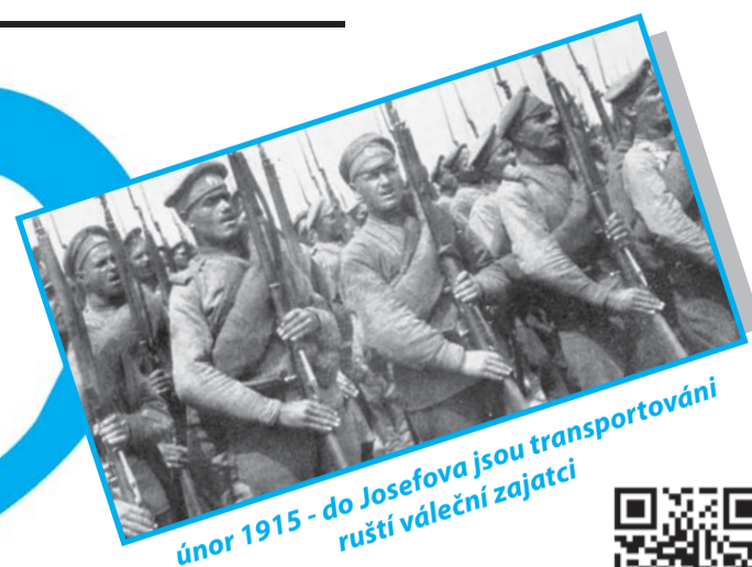
únor 1915 - do Josefova jsou transportováni ruští váleční zajatci