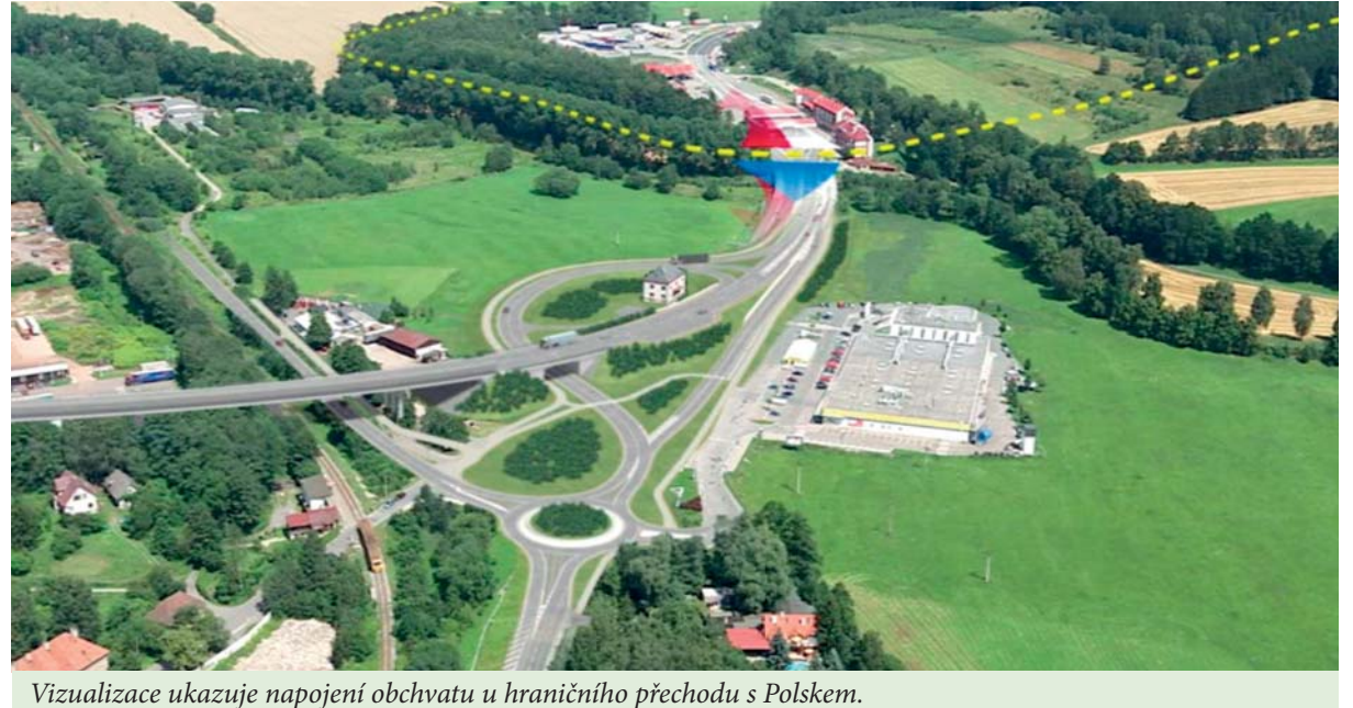
Vizualizace ukazuje napojení obchvatu u hraničního přechodu s Polskem.

řádu již nelze odvolat. Od prvního podání žádosti o územní rozhodnutí v roce 2009 uplynulo celkem osm let. Během územního řízení bylo třeba se vypořádat s téměř stovkou námitek a celý spis dnes obsahuje více než 2800 stran, samotné územní rozhodnutí čítá 230 stran. (kp)