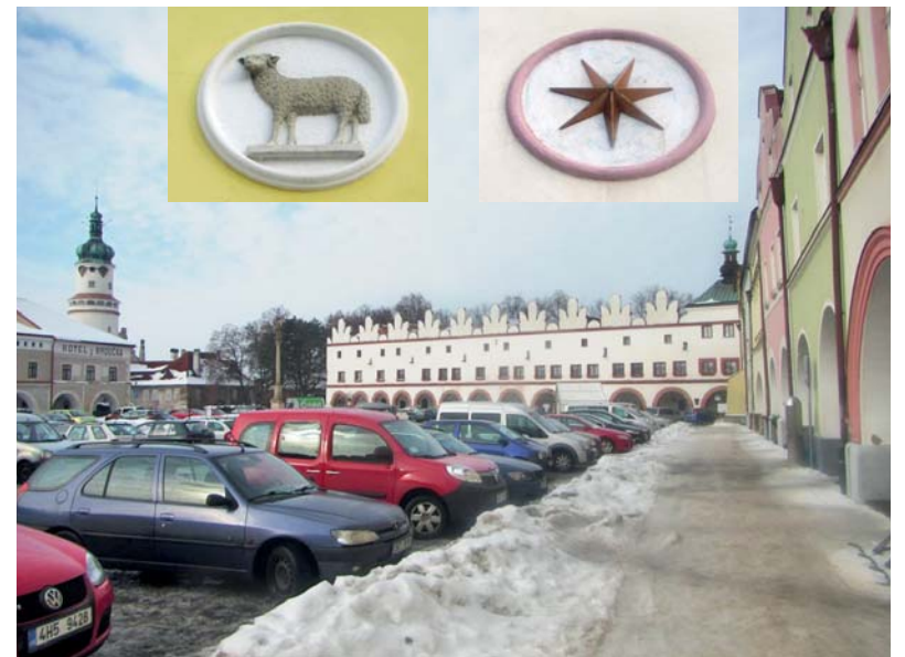
Novoměstské historické náměstí je krásné v celkovém pohledu i drobnostech, mezi které určitě patří domovní znamení. Patří mezi ně i znamení zlaté hvězdy a zlatého beránka (na objektech č.p. 1222, 1223)

V České Skalici se chystají na již 3. ročník Dne občanů, během kterého budou oceněni (za přínos životu a rozvoji města) jednotlivci nominovaní přímo občany. Akcí zajišťuje Komise pro obřady a slavnosti města Česká Skalice. Nominace jsou přijímány do 30. dubna. Slavnostní večer proběhne 24. června v Jiřinkovém sále Muzea Boženy Němcové. Moderátorem zde bude herec Jan Čenský.