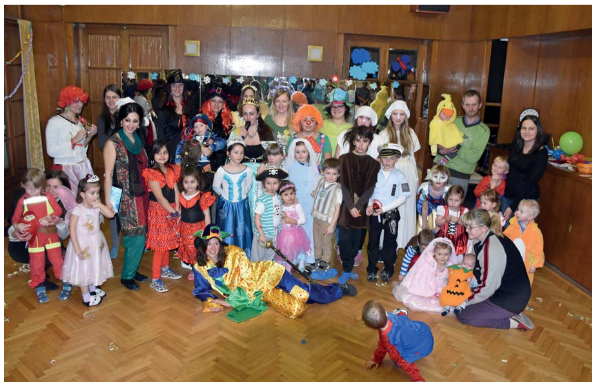
Poslední lednovou nedělí se v náchodském Děčku konal VELKÝ POHÁDKOVÝ KARNEVAL. Nechyběly rozmanité masky, ani hry a soutěže pro děti.

fibrilátor Lifepack 1000. Za částku 57 000,-Kč jim toto zařízení, které zvyšuje šanci přežít zástavu srdeční činnosti, zakoupilo město Rtně v Podkrkonosi.