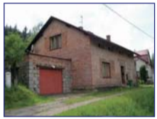
Obec: Stárvov Okres: Náchod Samostatně stojící RD v okraj. části obce. V domě je kuchyně s jídelním koutem, obýváč a ložnice. Dále sklípky, spíž, velká koupelna a WC, půda vhodná k vestavbě. Na opl. zahradě o celk. vým. 697 m 2 je zděná kolna. Na dům navazuje zděná garáž. Sítě veř., septik, ÚT, pevná paliva + el. přim. Dobrý stav.tech. stav. Příjemné a klidné bydlení. IHNED VOLNÉ !!