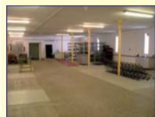
Obec: Machov N. Srbská Okres: Náchod Zděný, přízemní objekt s dobrým příjezdem s užit.p. 648 m 2 . Dispozice – velká hala, 3 menší haly, garáž, 2x umývárny, 3x WC, 3 kanceláře, kuchyňka a sklad. rampa. Z boku objektu 2 menší místnosti a sklípky. Sítě z veř. řádu, 230/400V, ÚT plyn. Vše v výborném stavu – nová střecha, plast. a sklobetonová okna, v kancelářích dlažba, možnost využití podkrovní. Vhodné k všestrannému využití.