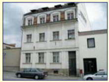
Obec: Česká Skalice Okres: Náchod Větší, bytový dům s byty 1+2 cca 75 m 2 , 1+3 cca 100 m 2 a 1+3 cca 95 m 2 v atraktivní lokality / u náměstí /. Objekt je část podskl. s půdou k vestavbě. V bytech je koupelna, WC a spíž. Sítě z veř. řádu, ÚT plyn, v jednom bytě akumul. kamna. V ceně je pěkná, opl. zahrada, celk. vým. poz. 923 m 2 . Stav. tech. stav dobrý, potřeba drobných úprav. Zaujímavá cena – dobrá investice.