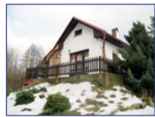
Obec: Červený Kostelec Stojín Okres: Náchod Zděná, rekreační chata v krásné, přírodní lokality se zahradou o celk.výměře 358 m 2 . V suterénu sklíp- ek a větší místnost. V přízemí obyt.míst- nost – vchod na terasu, sprch.kout a WC. V podkro- ví ložnice – zatepleno+palubky. Voda sezonní, odpady trativod, 230/400V, topení lokální. Dobrý stav. Půvažně místo k rekreaci.