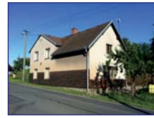
Obec: Červená Hora Okres: Náchod Pěkný RD s opl. zahradou o celk. vým. 676 m 2 a skleníkem. V přízemí domu je chodba, komora, kuchyně a pokoj, sprch. kout, uhelna, vodárna – stúdna, menší dílna, velká dílna a suché WC. V patře jsou dvě místnosti a půda k vestavbě. Sítě veř., topení lokální – ÚT. Na dům navazuje kolna. Nová střecha a fasáda. Přijemní bydlení – super cena !!