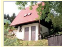
Obec: Náchod - Karlův Kopeček Okres: Náchod Velmi pěkná, udržovaná chata se zděným suteré- nem a dřevěným, zateplným podkro- vím. V objektu je v 1.PP kuchyňka, komora, chemická WC a sprcha s průtok. Ohříváčem. V přízemí pokoj a v podkro- ví ložnice. Voda i elektrina zavedeny, odpady trativod. Pozemek s terasou, letním sezenním o celk. vým. 355 m 2 . Pěkné místo s pěkným výhledem! V ceně zařízení a vybavení!