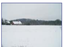
Obec: Zlích u Č. Skalice Okres: Náchod Prodej zajímavých, stavebních pozemků v příjemné, atraktivní lokality, v okrajové části obce. Dobrý příjezd. Na hranici pozemků zavedeny inženýrské sítě – voda, kanalizace, plyn a elektrika. Určene k výstavbě rodinných domů. Možnost odměřit velikost parcely, dle požadavků. Celková výměra poz. 12 164 m 2 . Zaujímavá cena !!