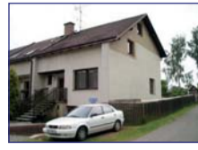
Obec: Horní Radechová Okres: Náchod Radový, koncový RD /kol. 1997/ v příjemné lokality, s opl. zahradou o celk. vým. 445 m 2 s pergolou a kolnou. V suterénu garáž 73 m 2 s dílnou, 3 sklípky. V patře zádveř, WC, obýváč s volnou disp. do kuchyně, vstup na zahradu. V 2.NP koupelna s WC, šatna, 3 pokoje, balkon, větší půda. Voda veř., spol. ČOV, el.přimotopy, krb. kamna. Příjemné a klidné bydlení.