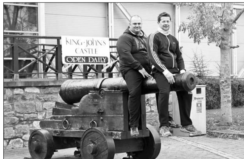
Jirka v Irsku ve stylu „Tankového praporu“

mi to připadalo mrňavý hlavně v Hotelu Ferrari. Postel tak malá, že jsem se nemohl ani otočit. Koupelna na chodbě celá plastová a mrňavá. Málem jsem se s ní převrátil... Sladké snídaně, bagetky a nugetky. Ale jinak Francouzi docela příjemní. Jasně, německy se jim mluvit nechtělo. Ve hře o domluvu zůstala angličtina a překvapivě i ruština. Francie byla fajn stejně jako Irsko. Jen jsme tam měli takovou veselou příhodu. Volant mají