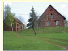
Obec: Červený Kostelec Horní Okres: Náchod Starší RD v slunné lokality se stav.poz. 2 173 m 2 . V domě je velká chodba, 2 místnosti, kamenný sklep, dílna a navazují bývalé chlévy. Velká půda k vestavbě, nová střecha. Voda z veř. řádu ve sklepě, el. 230/400V, topení lokální /kachl. kamna/, trativod. Na poz.starší zděná stodola. Možno dokoupit navazující stav.poz. Po úpravách velice příjemné bydlení.