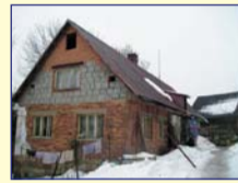
Obec: Vysoká Srbská Okres: Náchod Samost. stojící RD hosp.stavení na okraji obce. V domě velká chodba, kuchyně, 2 pokojů, koupelna, dílna, spíž, WC a průchod do chléva. Velká půda s 1 míst- ností, sklep. Velká stodola – nutná oprava, kolna a zděný chlév. Voda veř., žumpa, 220/380 V, ÚT-pevná + lokální. Navazující poz. o celk. vým. 39 063 m 2 ! Úpravy a opravy nutné! IDEÁLNÍ K HOSPODÁRENÍ!