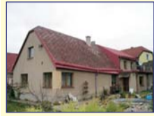
Obec: Červený Kostelec Okres: Náchod Pěkný RD s opl. zahradou 1 165 m 2 , zděnou garáží, kolnou, pergolou a udrimov. V domě je veranda, šatna a kamenný sklep. Kuchyně, velký obýváč, 2 pokoje, koupelna s WC a travin. sklep. Půda k vestavbě. K domu je přistavěná nová bytjed. 1+1 cca 43 m 2 se samost. vchodem a měřidly. Voda veř., septik, 230/400V, ÚT plyn + elektroko- tel. Dům je po větších opravách. Klidná, atraktivní lokalita.