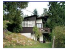
Obec: Úpice Podrač Okres: Trutnov Pěkná, zděné chaty v Úpici – Podrač, na slunném poz. o vým. 2304 m 2 z to- ho cca 200 m 2 lesní porost. Dispozice – veranda, 2 místnosti, voda z veř. řádu- sezonní, WC, topení krbem- nová litinová vločka. V suterénu dílna a uhelna, el. 230/400, septik. Na poz. nová kolna, bazén se solár. ohřevem a písk. filtrač, letní sezenní, fóliovník. V ceně veškeré vybavení.