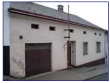
Obec: Náchod Okres: Náchod Prostorný RD – státek Radový RD s větší garáží a s opl. zahradou o celk. vým. 895 m 2 , v okrajové části obce. V přízemí – chodba, kuchyně, 3 pokojů, koupelna a WC, kamenný sklep. V podkrovní 2 jednoduché místnosti a 3 půdy. Na poz. 2 zděné kolny. Sítě z veř. řádu, ÚT horkovodní, 230/400 V. Roh domu staticky narušen. Po opravách příjemné bydlení !

RK REKA - RYCHLOST, JISTOTA, SPOLEHNIVOST