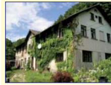
Obec: Česká Metuje Okres: Náchod Velký, 2 podlažní dům s opl. poz. o celk. vým. 4 610 m 2 . V přízemí chodba, kuchyně, WC, kamenný sklep, 2x dílna, kotelná, 1 menší a 1 velká místnost. V patře byt 1+3 a 1 velký pokoj, koupelna, komora a WC. Možná půdní vestavba. Voda veř., 230/400V, 3 komor.septik, ÚT pevná. Na dům navazuje garáž a stodola, dřevník a kolna. Atraktivní lokalita 12 km Adršpach.