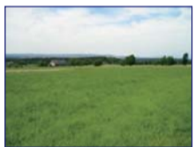
Obec: Kramolna Okres: Náchod Rovinatý, stavební pozemek o celk. vým. 1.200 m 2 v atraktivní lokality v výhledem do přírody. Sítě v do- sahu: kanalizace cca 25m, veř.vodovod cca 100m, plyn cca 20m, elektrika cca 15m od hranic pozemku. Dobrý příjezd, vhodné ke stavbě RD. Klidné a příjemné bydlení.