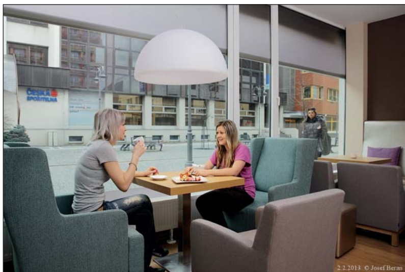
V letních měsících doplní posezení v interiéru kavárny i venkovní zahrádka.