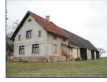
Obec: Lhota pod Hoříčkami Okres: Náchod Větší, zemědělská usedlost na okraji obce o poz. 7.348 m 2 . Objekt tvoří dva domy, nová, komerční přístavba, stodoly a chlévy. V domě je nový byt, koupelna, WC, dlažba apod. V druhém domě je připraven další byt k dodání. Voda veř., el. 230/400V, topení plyn + pevná, trativod. Vhodné k bydlení i k podnikání. Pěkná lokalita.