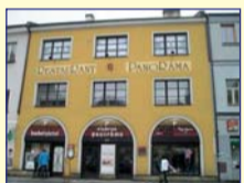
Obec: Náchod Okres: Náchod Prostorný restaurace v 1.patře s výhledem na náměstí o celk. vým. cca 326 m 2 . Dispozice – restaurace s barem, kuchyně, sklad, tech. a soc. záz. pro personál, toalety pro hosty, 2 sepré salonky, kuchyně, sklad a tech.záz. V přízemí vinárna s kompl. zázemím cca 170 m 2 . Vše v dobrém stavu. Cena bez služeb. Možnost pestřeho využití a parkování. Lze zřídit letní zahradku na chodníku. Zaujímavá atraktivní a lukrativní lokalita.