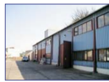
Obec: Zbečín Okres: Náchod Opl. komplex 2 objektů o vým. 789 m 2 na sebe navazujících / přichodcích/ v okraj- části obce s příjezdem i pro kamiony. Haly z dvojitého hlin.plechu s minerální izolací. Voda z veř. řádu, odpady do jímky, el. 2x přívod /Al + Cu/, topení plyn. kotel a plyn. fukary. V objektu 2 kanceláře, šatna s soc. záz. Panelová, manip. plocha 3 800 m 2 . Vše v výborném stavu, po revizích. IHNED VOLNÉ !!