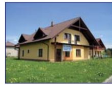
Obec: Žďár nad Metují Okres: Náchod Nadstavba novostavby RD 6+1 o podl. pl. 257 m 2 . Přízemí – chodba, hala, koupelna, WC, garáž, kuchyně s jídeln. koutem a obýváčem, terasa, komora a pokoj. V patře 4 pokoje, balkon, koupelna, WC a šatna. Sítě veř., nízkonáklad. topení – podlah., možnost vodní, krb. vločky. Vše v masivu. Roz. pro TV satelit, PC. Bezbariér. vstup. Poz. 1.140 m 2 . Dodávky dle přání v ceně.