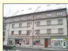
Obec: Náchod Okres: Náchod Byt 1+kk v O.V., ve 1 patře cihlového domu, 28,5 m 2 . V bytě je chodba s kuch. linkou, WC, prostorný pokoj a malá komora. Plast. okna s výhledem do dvora, voda a od- pady z veř. řádu, topení plyn WAW, sklep, možnost parkování ve dvoře. Cena vč. vybavení. Příjemné bydlení poblíž centra města, v dosahu veškerá občanská vy- bavenost. IHNED VOLNÉ !!!!