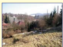
Obec: Náchod Pihov Okres: Náchod Zaujímavý, mírně svažitý pozemek – zahrada /vhodné i k výstavbě/, v atrak- tivní lokalitě 5 min. chůze z centra Pihova, s příjemným výhle- dem. Celková výměra pozemku činí 284 m 2 . Voda, elektrika, veř. kanalizace a parovod na hranici pozemku. Dobrý příjezd. Vhodné k rekreaci i k výstavbě chaty i RD.