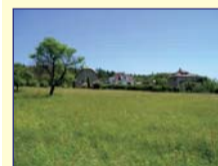
Obec: Kramolna u Orli horách Okres: Náchod Prodej rovinatého, stavebního pozemku o výměře 5 283 m 2 s dobrým příjezdem, v krásné, přírodní lokality u Kramolně. Možnost prodeje i po částech dle dohody. Na hranici pozemků vede plyn a veřejný vodovod, na poz. kanalizační řád, el. v dosahu. Příjemný výhled do kraje. Klidné místo k bydlení.