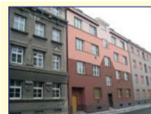
Obec: Jaroměř Okres: Náchod Větší byt v os.vlast. 3+1 o výměře 79m 2 ve zděném, bytovém domě v 4. patře bez výťahu. V bytě je velká chodba, kuchyně, spíž, 3 pokoje, koupel- na, samostatné WC a balkon. Sítě veřejné, ÚT – elektrické, plyn v mezipatře, možnost využití kominy. Byt je standardní, plastová okna, nová fasáda domu. K bytu patří půdní prostora a sklep. Možnost parkování za domem. IHNED VOLNÉ