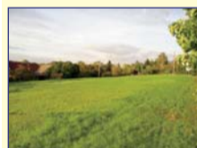
Obec: Vysokov Okres: Náchod Stavební, rovinatý pozemek o celkové výměře 2 286 m 2 v okrajové lokalitě obce, s dobrým příjezdem. Plyn, voda z veř. řádu a elektrika cca 70m. Vhodné k rekreaci i k výstavbě rodinného domu. Příjemná cena.