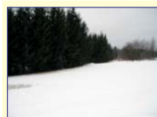
Obec: Bohdašín u Č. Kostece Okres: Náchod Mírně svažité stavební pozemek o celk. výměře 2520m 2 , v klidné lokalitě, zavedená voda z veř. řádu, elektrika 230/400V, s velmi do- brým příjezdem po asfaltové cestě. Příjemné místo pro rekreaci nebo bydlení, 9km Hronov, 12km Náchod a cca 1km Červený Kostelec. Zaujímavá cena !!!!!