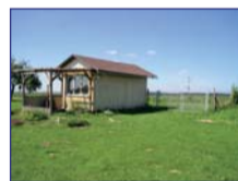
Obec: Miskolezy Okres: Náchod Pěkný, rovinatý, oplocený pozemek o celk. výměře 3.293 m 2 v okrajové části obce Miskolezy. Tč. užívání, jako ovocný sad – broskev, jablka ap. Dobrý, nezpevněný příjezd. Na pozemku buňka na nářadí. Sítě nezavedeny. Příjemná lokalita k zahradničení.