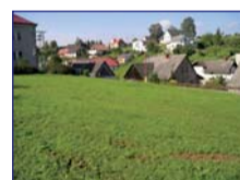
Obec: Červený Kostelec Horní Okres: Náchod Pěkný stavební poze- mek 1 137 m 2 v klid- né, slunné lokalitě s dobrým příjezdem. Možno dokoupit navazující stav.poz. za 490,- Kč/m 2 . Sítě u pozemku. Výborné místo ke stavbě rodinného domu.