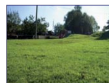
Obec: Červený Kostelec Horní Okres: Náchod Pěkný, rovinatý poze- mek o výměře 1 774 m 2 na krásném místě, v klidné, okrajové lokality s vlastním přístupem. Elektrika a voda z veřejného řádu v dosahu. Ideální k výstavbě rodinného domu.