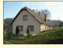
Obec: Liběchyně u N. Města n. M. Okres: Náchod Samostatně stojící RD se stodolou a poz. o celk. vým 1 376 m 2 na klidném místě v okrajové části obce, cca 5 km od N. Města n. Met. Dispozice – veranda, chodba, kuchyně a 4 pokoje, koupelna, WC, kotelná a větší sklep. Půda k vestavbě. Voda veř., žumpa, el. 230/400 V, ÚT na pevná paliva, 2 pokoje s krbem. Stav. tech. stav je dobrý. Příjemné a klidné bydlení.