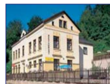
Obec: Rokytice nad Jizerou Okres: Semily Perfektní penzion v turis- tickém centru Křkonos i Jizerských hor. V část. podskl. objektu je res- taurace, jídelna-34 míst, salonek-22 míst, bar, kuchyně se zázemím, WC pro hosty i person- ál. V patře foyer, vybavené 4 pokoje (2-4 lůžka), kancelář-byt. Ve 2. patře je 5 pokojů (2-4 lůžka). Pokoje se soc. záz., topení el. přimotopy, voda ze studny, odpady vlast. ČOV. Opl. parkoviště, venk. bazén, altán, pozemek 1 707 m 2 . SUPER STAV!!! Vhodné k bydlení i k podnikání. Pěkná lokalita.