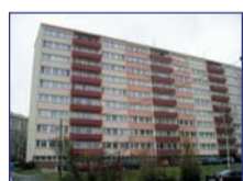
Obec: Náchod Okres: Náchod Příjemný byt 1+3 v os- ob.vlast. s balkonem o vým. cca 65 m 2 v 9. patře s výhledem do přírody, dům je zateplený. V bytě je chodba, komora, koupelna, WC, pokoj a kuchyně s linkou a sporákem na plyn. Sítě veř., topení ÚT dálkové, sklep a možnost užívání tech.zázemí. Byt je vymalovaný, nové podlahy, plast. okna, příjemně řešený. Možnost parkování. Ihned volný !!