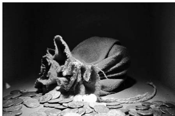
Nálezy římských mincí na našem území připomíná i expozice v nedávno otevřeném Archeoparku Věšterý na Královéhradecku.

stezku – viděnou optikou dnešních dálničních tahů) pochází od mineralizované pryskyřice třetihorných jehličnanů - jantaru. Bohatá naleziště tohoto minerálu se nacházejí právě u Baltického moře. A tak, ze starověkého Říma proudilo na barbarský sever luxusní zboží (bronzové nádoby apod.) a zpět se vracel jantar, med, kožešiny atd.