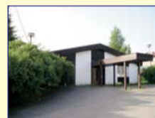
Obec: Horní Radechová Okres: Náchod Větší podnik. ob- jekt, zčásti zděný + montovaný, v centru obce příjezdem po zpevněné komunika- ci, se stav. poz. 1 773 m 2 . V objektu je celkem 22 kanceláři, menší kuchyňka a 2 x soc. záz. Inž. sítě veřejné, topení akumul. kamny. Možnost parkování. Ideální na sídlo firmy, projekční kancelář apod. Velmi dobrý stav. IHNED K UŽÍVÁNÍ!