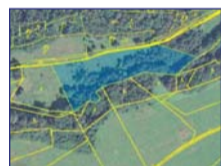
Obec: Bystrá u Orli horách Okres: Rychnov nad Kněžnou Mírně svažité poze- mek o celk. výměře 7 049 m 2 v nedaleké koupalšti, v klidné, přírodní lokalitě. Zaujímavá investice