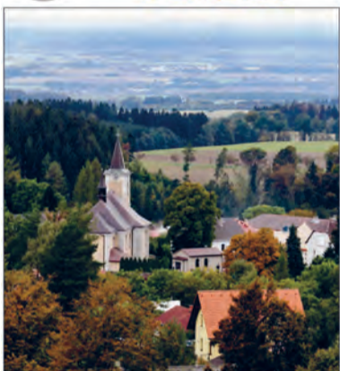
3/2022 - ČTVRTLETNÍ ZPRAVODAJ MĚSTYSU NOVÝ HRÁDEK