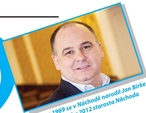
1. června 1969 se v Náchodě narodil Jan Birke, poslanec a od roku 2012 starosta Náchoda