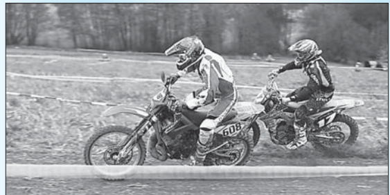
□ foto: Soubor Martina Štátného (st.č. 608) a Radovana Míla jun. (st.č. 17).