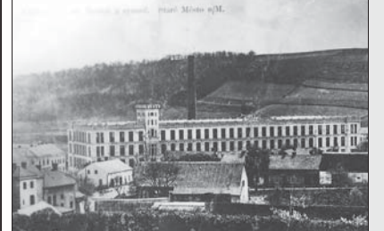
□ Bartoňova pádělna ve Starém Městě