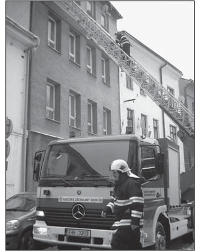
Rampouchy ohrožují v případě tání chodce a musí dolů. Snímek hasičské akce proti rampouchům pochází z náchodské Krámské ulice.