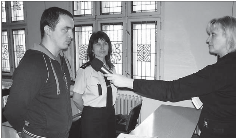
Tak dlouho chodil se džbánem pro vodu... čtěte na str. 4.

ŠANCE PRO PÁCHNIKA Lipová alej u silnice na spojnici Dobruška - Opočno aspiruje na zařazení do kategorie památného přírodního výtvaru. Je to dobrá šance pro budoucnost zajímavého a vzácného tvora, který žije v dutinách tamních lip. Dámy a pánové, není jím nikdo jiný, než málo známý brouk páchník hnědý. (r)